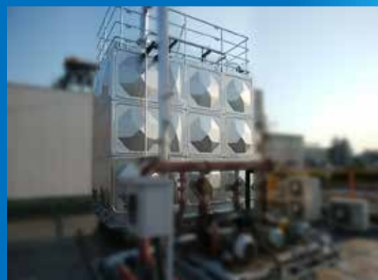
角型タンク（パネルタンク選定・購入品） 概寸：3500×2000×3000H