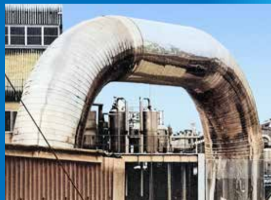
フラッシュドライヤ