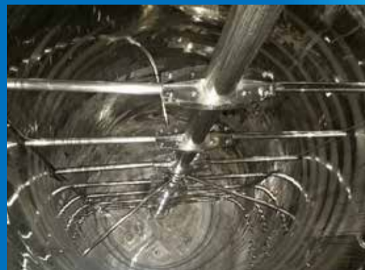
晶析塔 概寸：Φ3200×12000H （冷水ジャケット式）