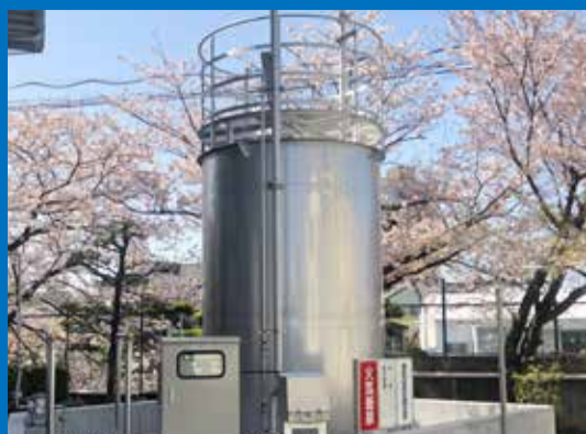
円筒型タンク 概寸：Φ2250×3570H