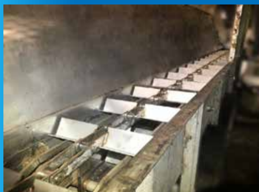
チェーンコンベヤ 概寸：400×6000L