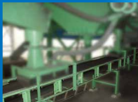
ベルトコンベヤ 概寸：350W×29000L