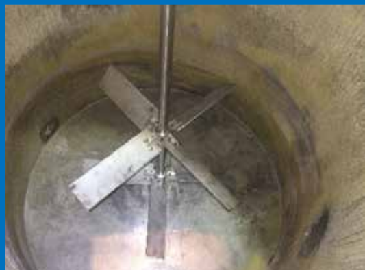
4枚パドル翼型攪拌機