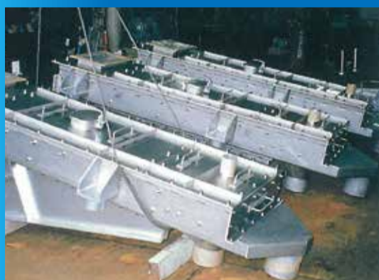
振動篩機 概寸：Φ1000×60mesh 2基