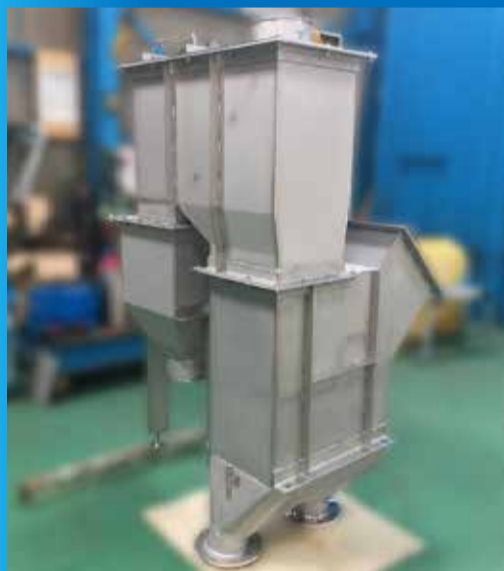
水切りスクリーン