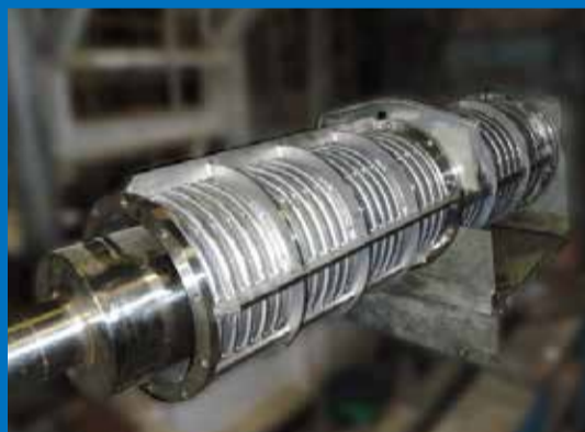
脱水機（スクリーブレス）