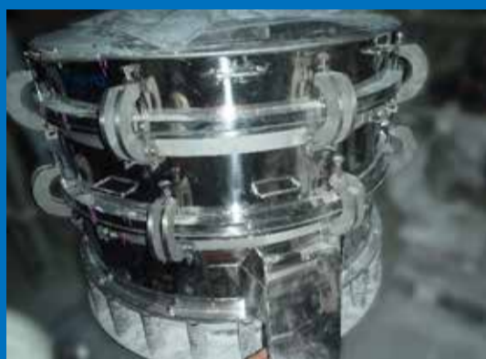
円型振動篩機（選定・購入品）