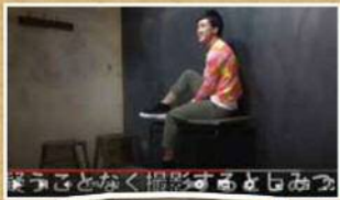
東海オンエアさん