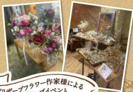
プリザーブフラワー作家様による ポップアップイベント