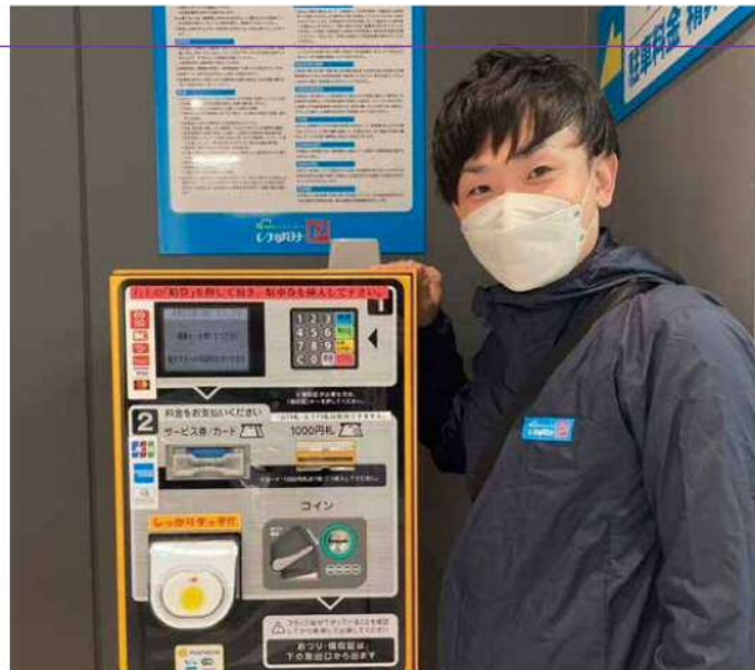
いずみパーキング 新栄営業所 現場統括マネージャー